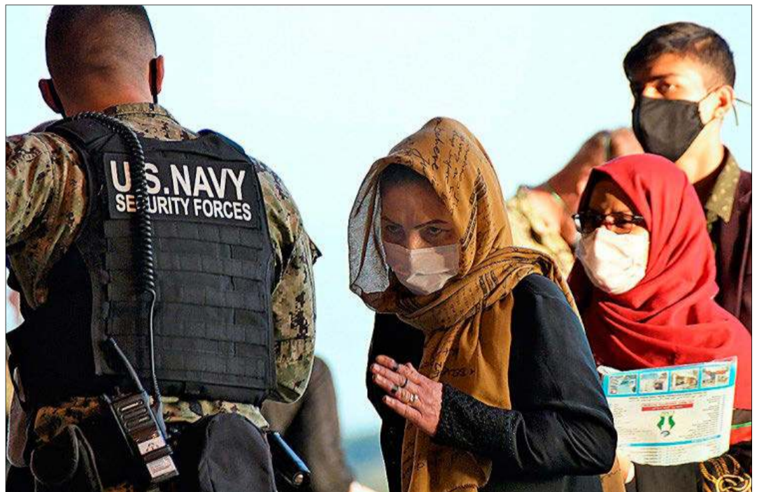
Refugiadas afganas son recibidas por soldados norteamericanos, ayer, en la base de Rota. CATA ZAMBRANO