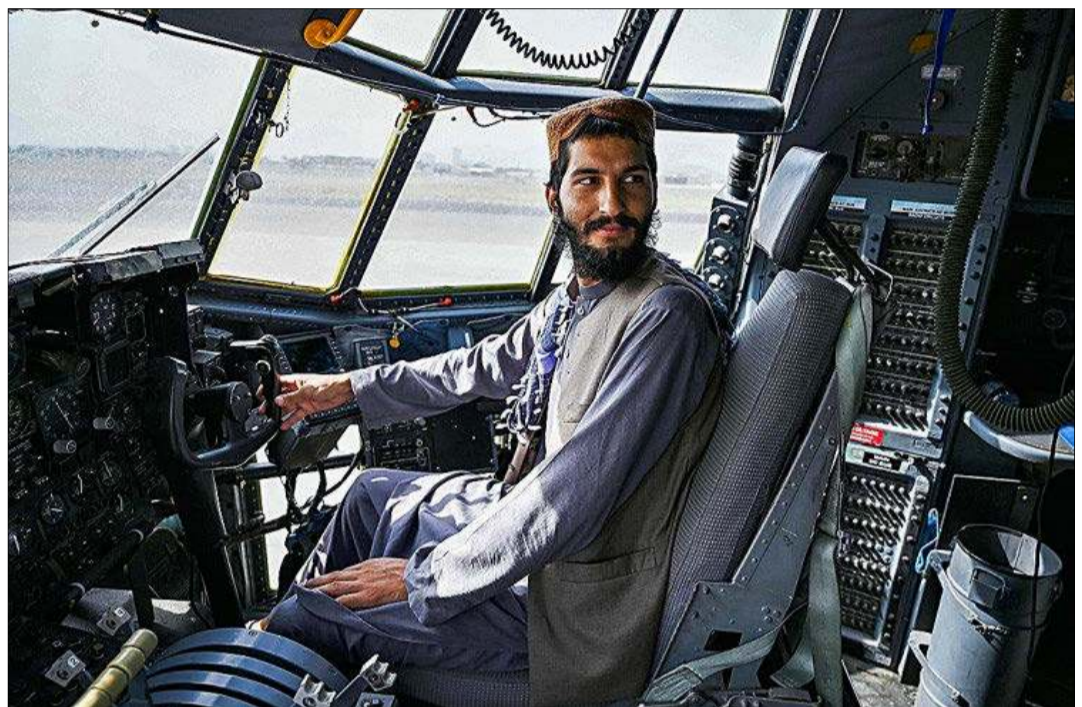
Un combatiente talibán se sienta en la cabina de un avión de la Fuerza Aérea afgana, ayer, en Kabul.